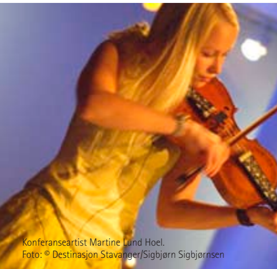
Konferanseartist Martine Lund Hoel.