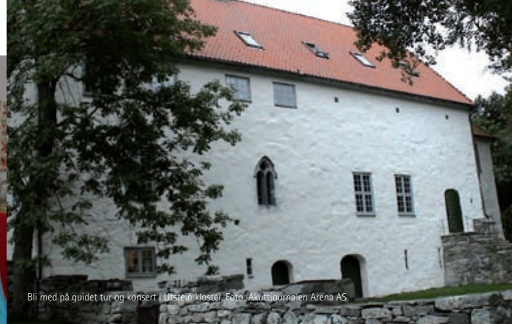
Bli med på guidet tur og konsert i Utstein kloster.