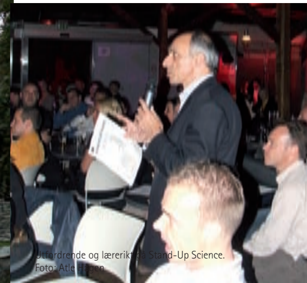
Utfordrende og lærerikt på Stand-Up Science.