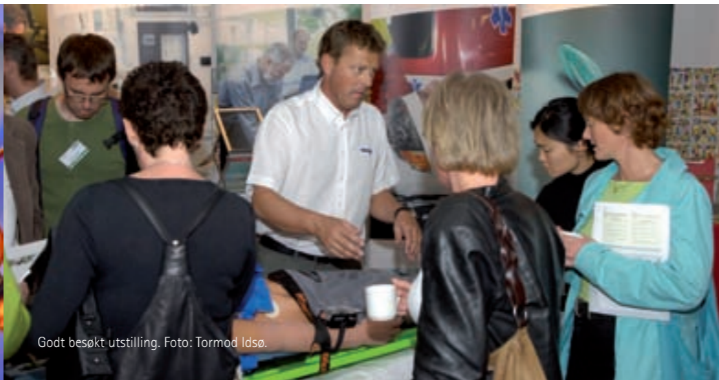
Godt besøkt utstilling.