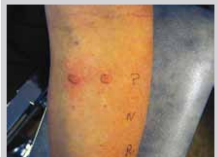
Prikktesting pga mistenkt anafylaktisk reaksjon.