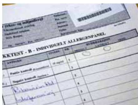
Dokumentasjon av prikktest.

AV ANNE BERIT GUTTORMSEN, - ANNE.GUTTORMSEN@HELSE-BERGEN.NO OVERLEGE, DR PHILOS, PROFESSOR, KIRURGISK SERVICEKLINIKK, HAUKELAND UNIVERSITETSSYKEHUS, BERGEN