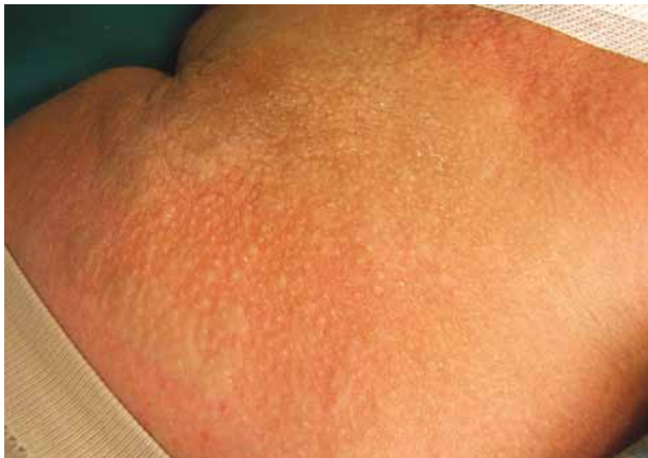
Eksempel på urtikaria.